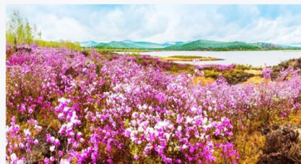
满足你对山河的赞美