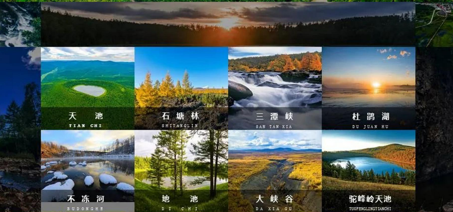
天池 TIAN CHI