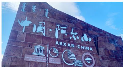
满足你对小镇文化的加深