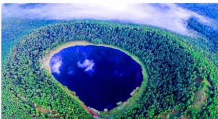
满足你对森林奇观的向往