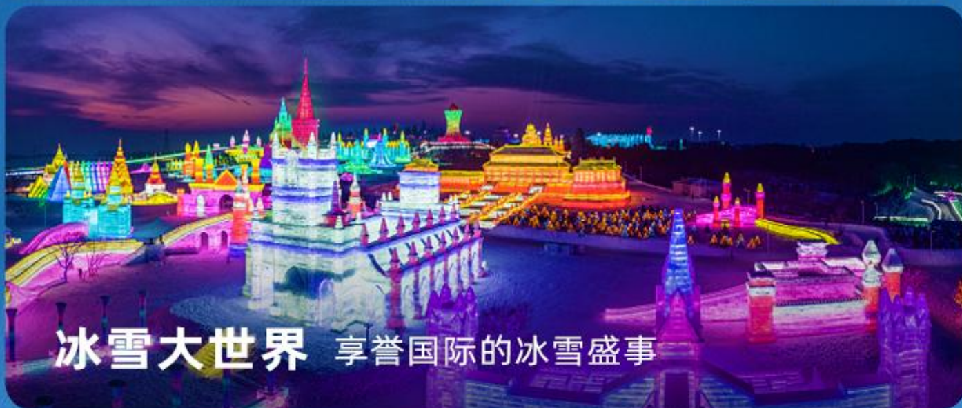
冰雪大世界 享誉国际的冰雪盛事