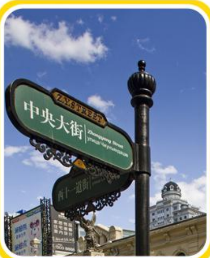
东方小巴黎哈尔滨