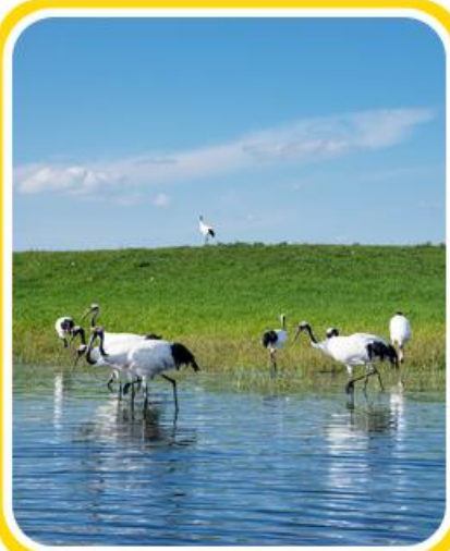
齐齐哈尔扎龙湿地