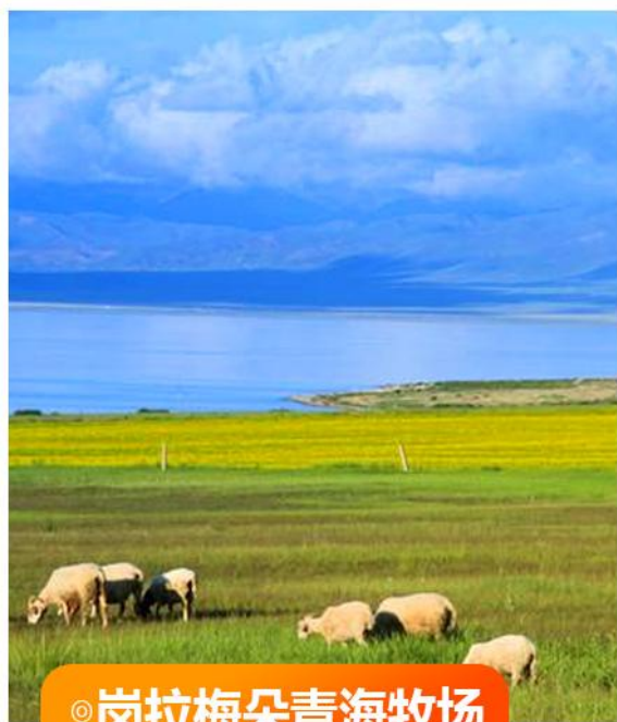
◎ 岗拉梅朵青海牧场