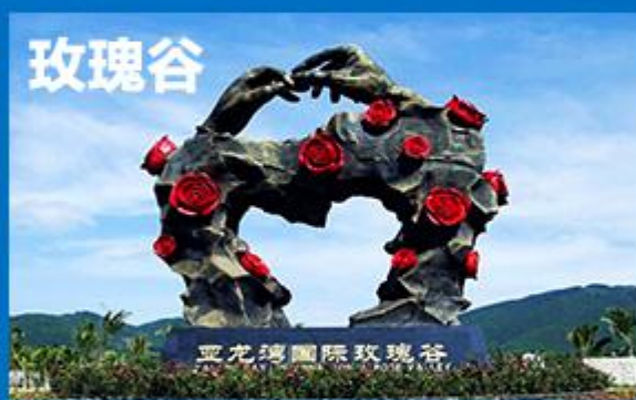
亚龙湾国际玫瑰谷