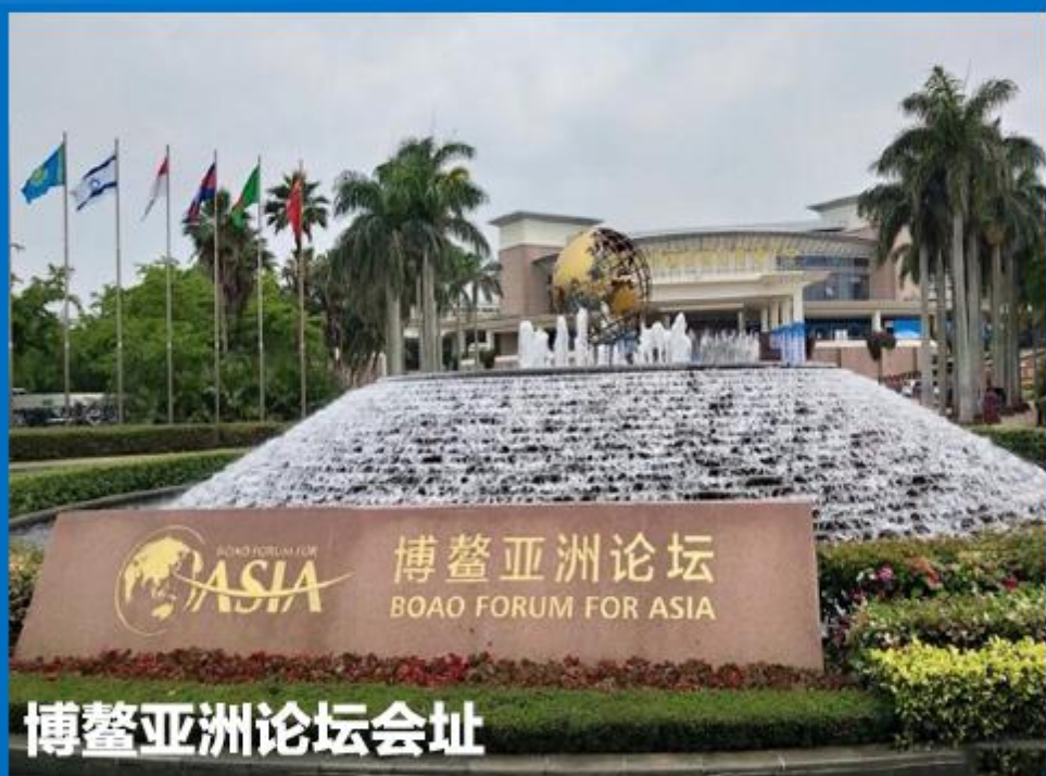
博鳌亚洲论坛会址