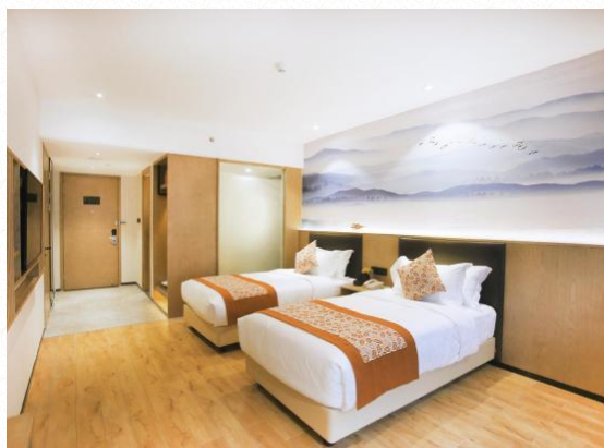
超豪华酒店：阳朔--美豪/碧玉/新西街或同级