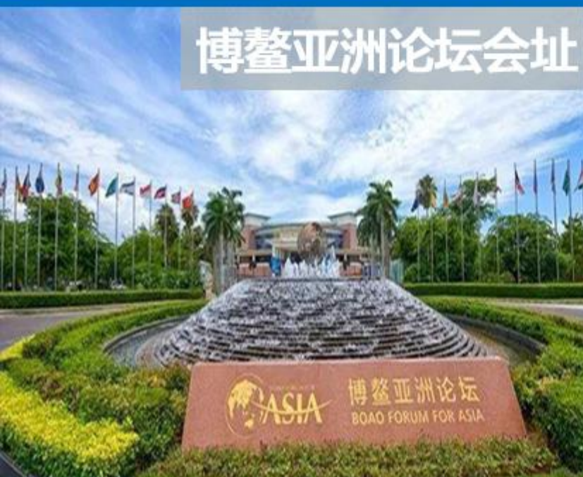
博鳌亚洲论坛会址