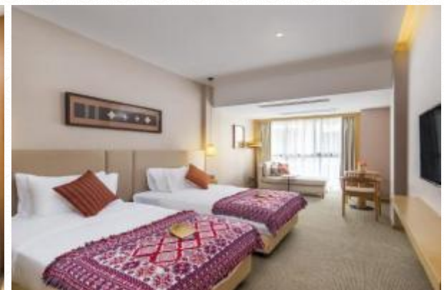
超豪华酒店：阳朔--花筑/铂漫/天空之境或同级