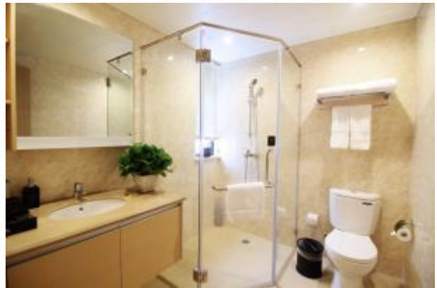
超豪华酒店：桂林--红璞/凯里亚德/曼哈顿或同级