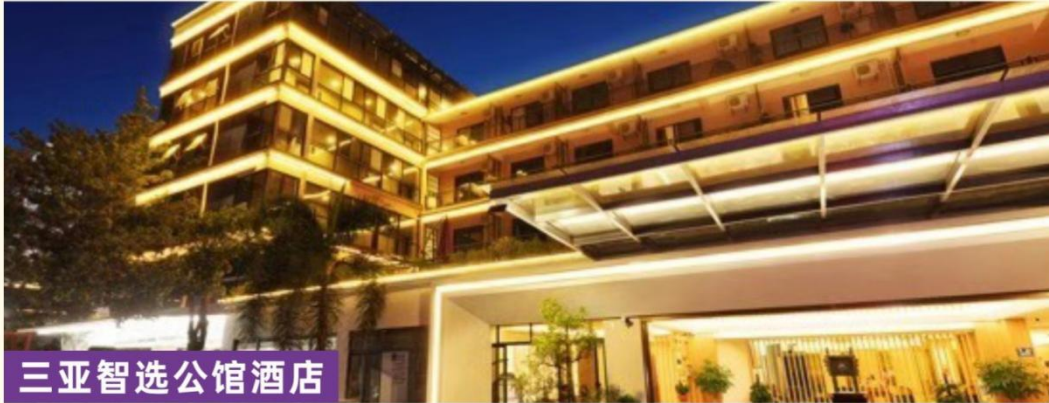
三亚智选公馆酒店