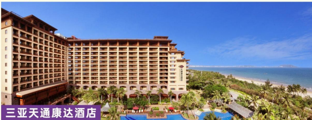
三亚天通康达酒店