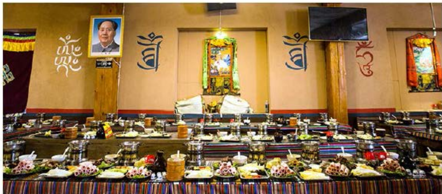
体验藏族歌舞伴餐