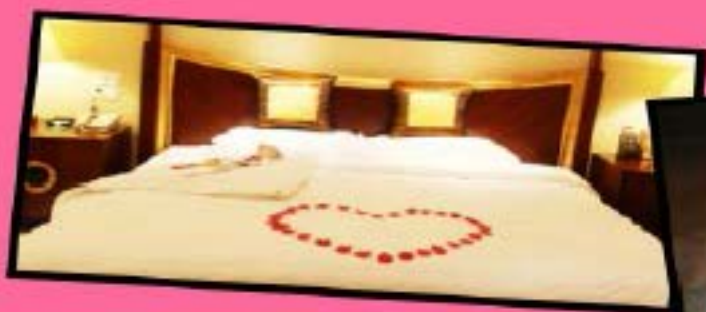
新婚蜜月行赠送一晚鲜花铺床