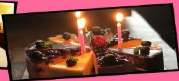
行程中过生日赠送蛋糕一个