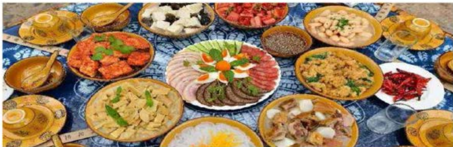
地道味旅，品尝不一的美食