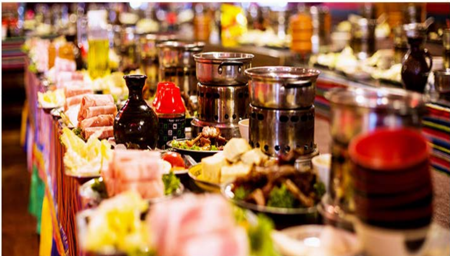
体验独特的藏族歌舞伴餐