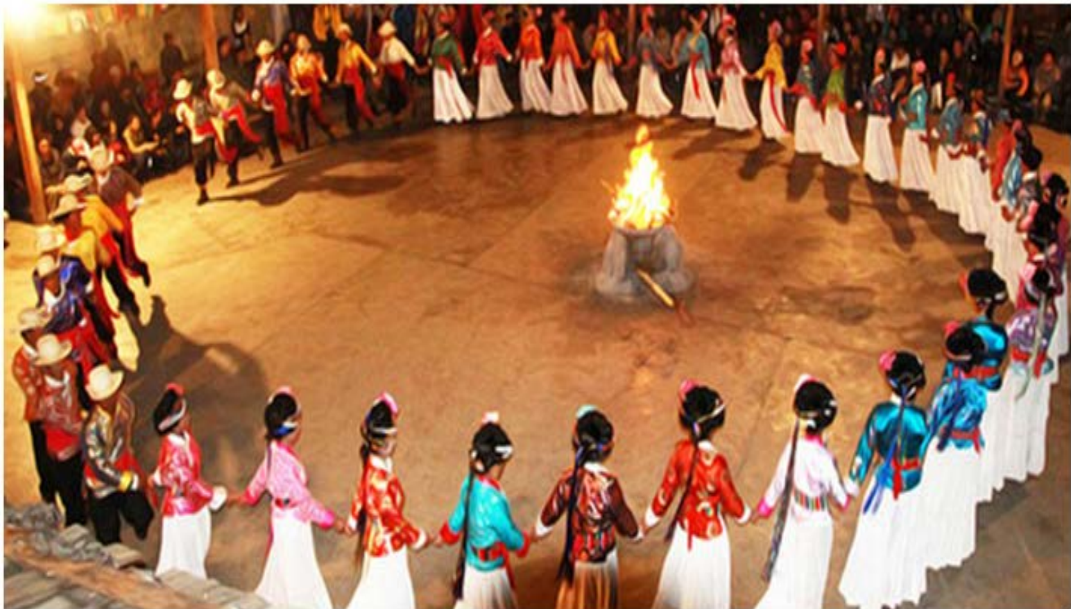
摩梭人民举行的盛大篝火晚会