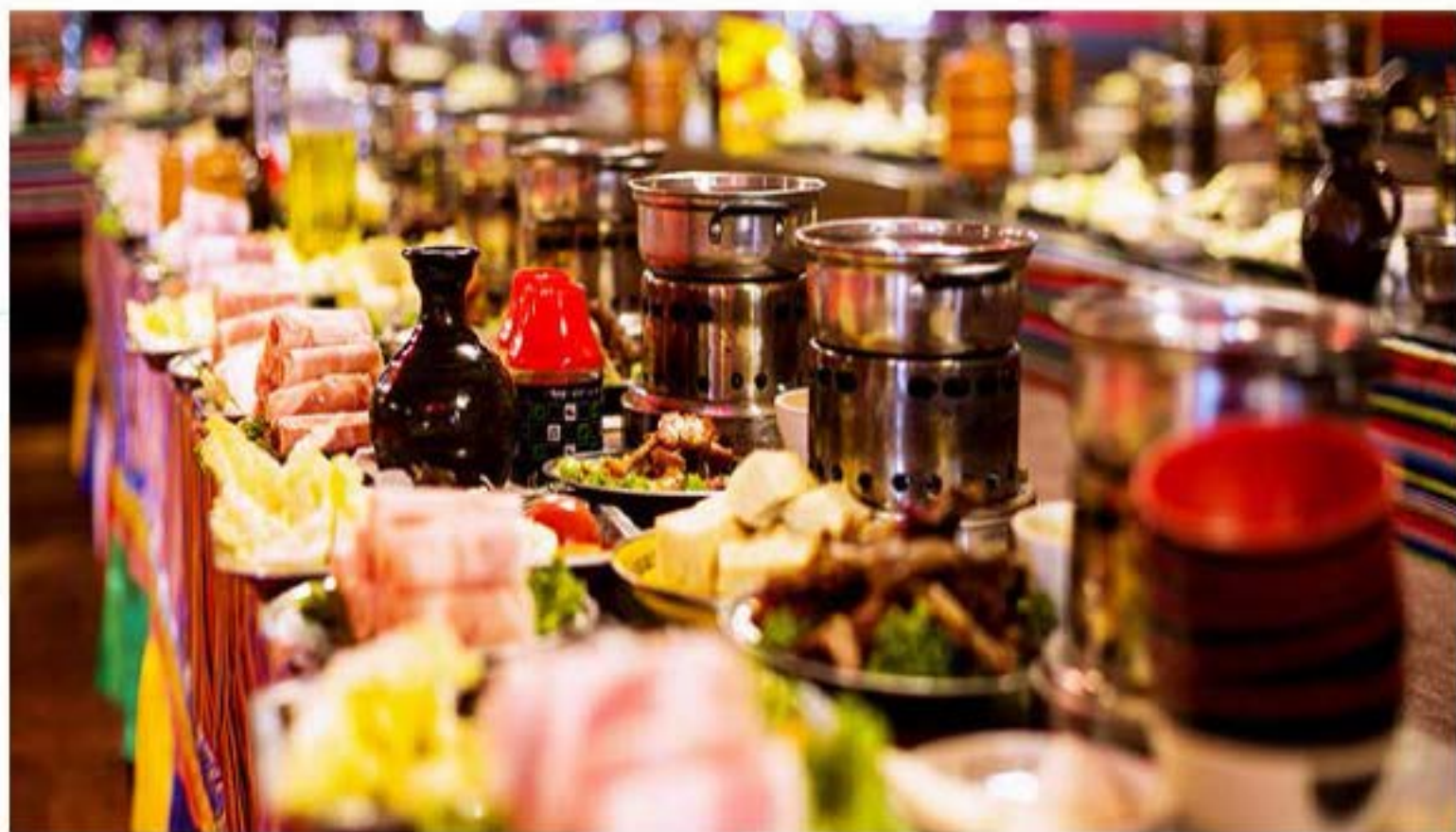
体验独特的藏族歌舞伴餐