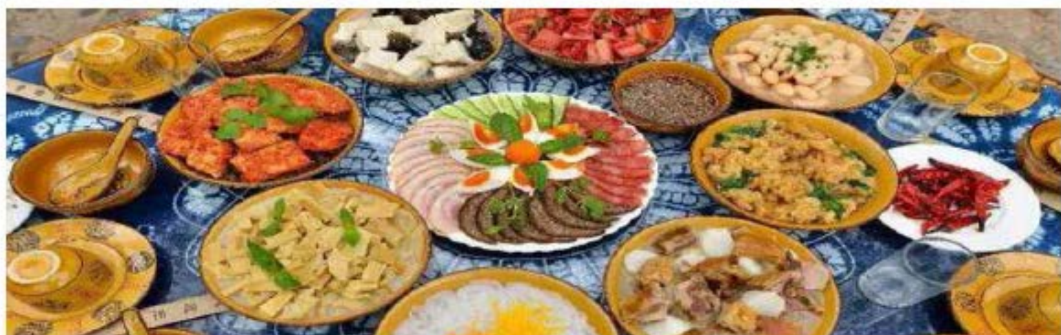
地道味旅，品尝不一的美食