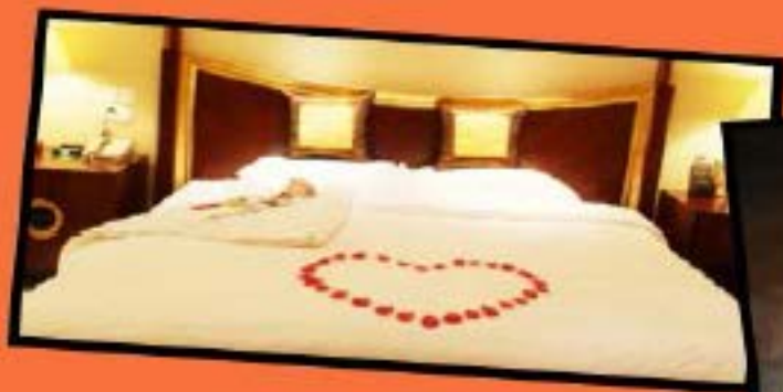
新婚蜜月行赠送一晚鲜花铺床