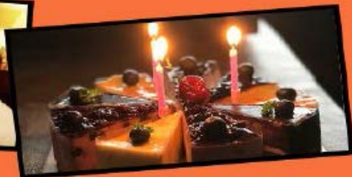
行程中过生日赠送蛋糕一个