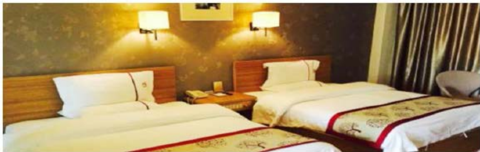
精选当地酒店，舒适便捷入住，消除旅途的疲劳