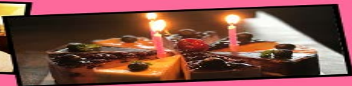
行程中过生日赠送蛋糕一个