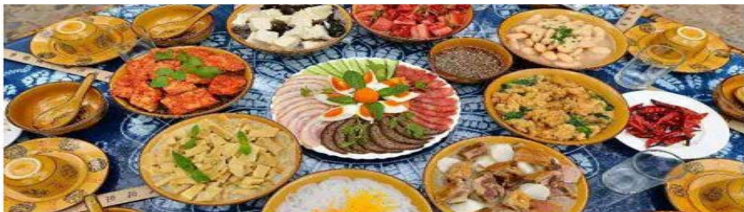
地道味旅，品尝不一的美食