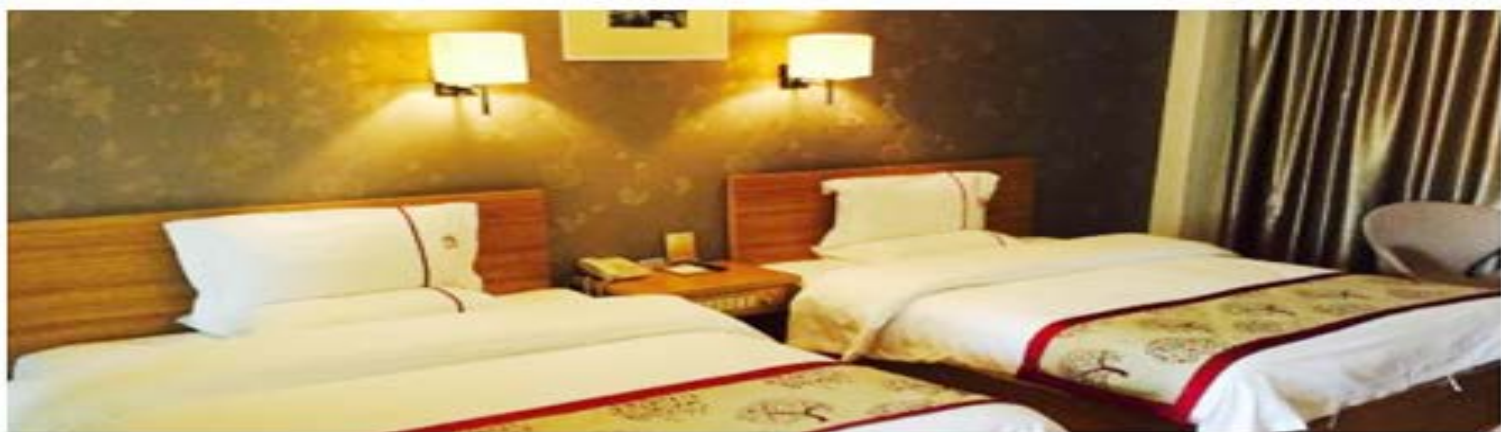
精选当地酒店，舒适便捷入住，消除旅途的疲劳