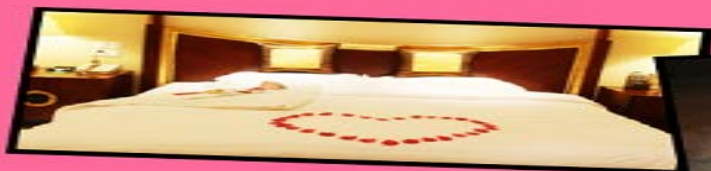
新婚蜜月行赠送一晚鲜花铺床