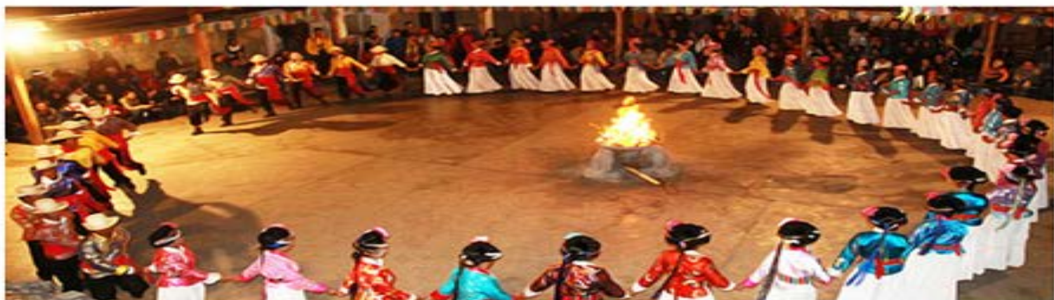
摩梭人民举行的盛大篝火晚会