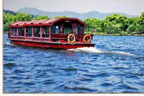
VIP包船深度游览大小西湖 (尊贵免排队)

我到横店拍电影：[清明上河图]全团1人1角色+专业服装化妆全套体验拍电影 横店影视城民国服装互动游览[广州香港街] 禅意小镇拈花湾-汉服游园