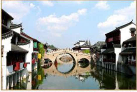
双水乡-乌镇/周庄 中国四大园林之一：耦园