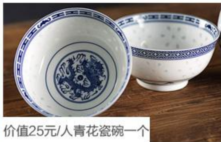
价值25元/人青花瓷碗一个