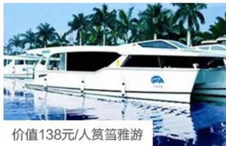
价值138元/人筲箕雅游