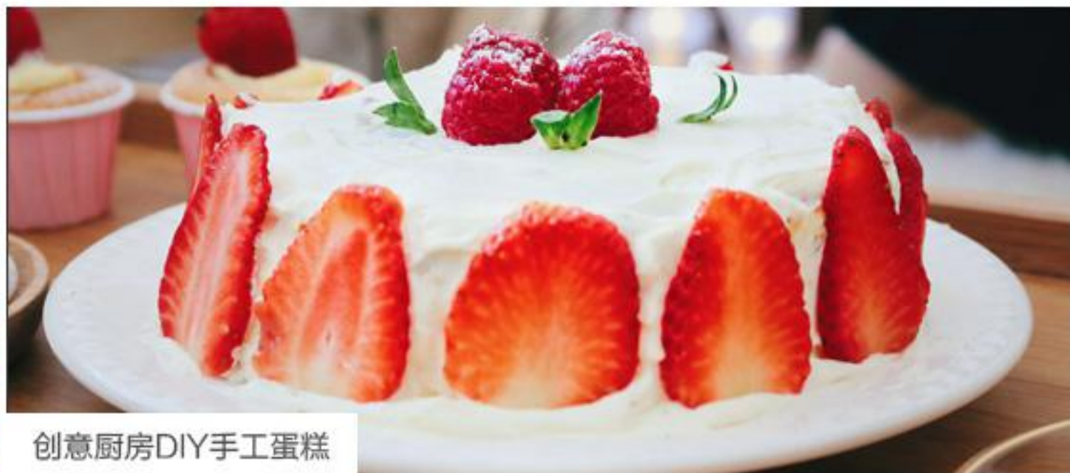
创意厨房DIY手工蛋糕

IT'S A ROMANTIC TOUR — FUJIAN QUALITY TRAVEL