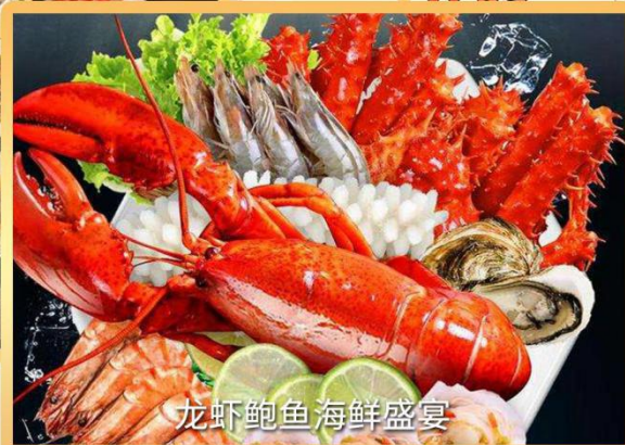
龙虾鲍鱼海鲜盛宴