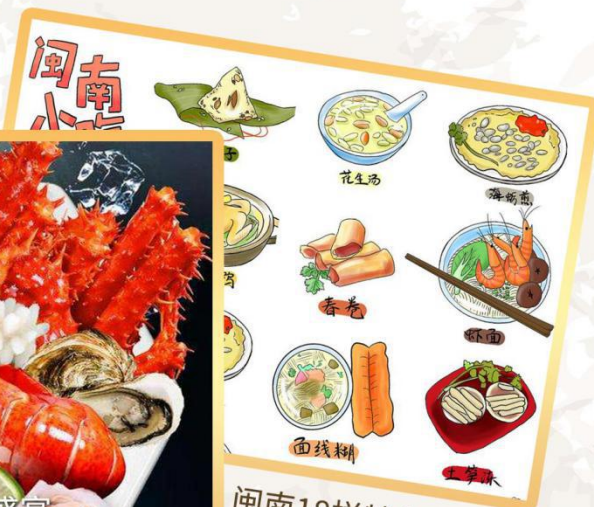
闽南18样特色小吃宴 (费用自理)