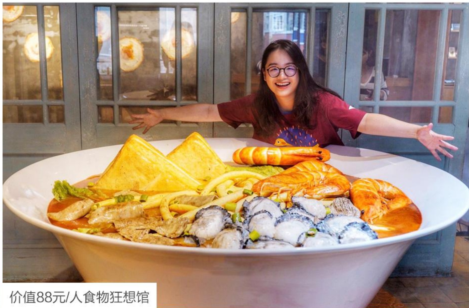
价值88元/人食物狂想馆

IT'S A ROMANTIC TOUR ——— HAPPY QUALITY TRAVEL