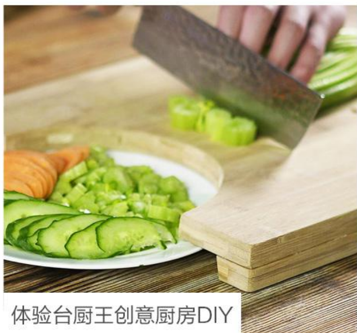
体验台厨王创意厨房DIY