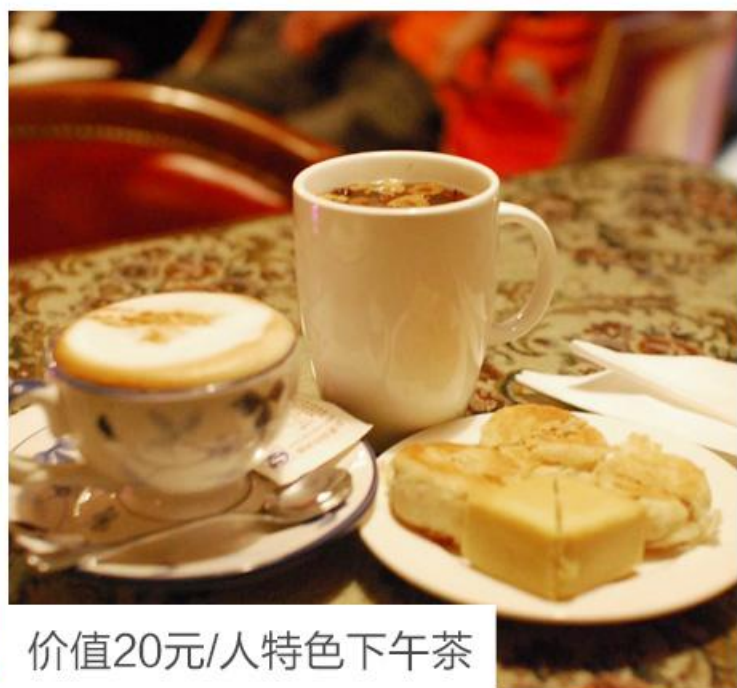
价值20元/人特色下午茶