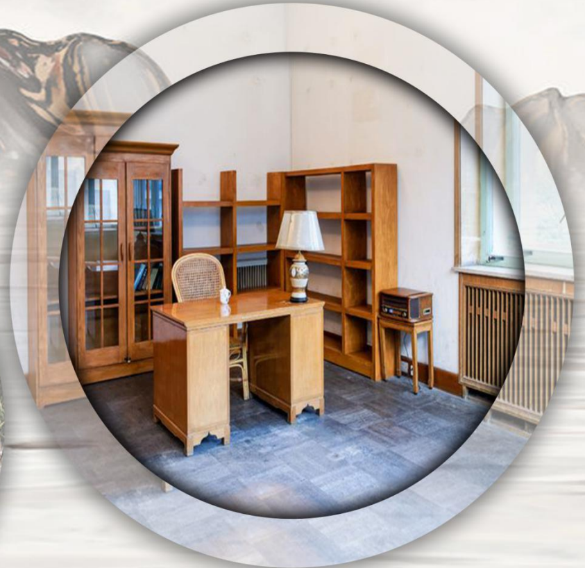
林彪行宫 — 704 工程 LIN BIAO XING GONG QILINGSI GONGCHENG