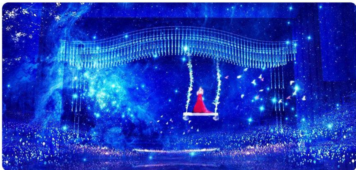
【邓丽君传奇全息音乐奇幻秀360°】