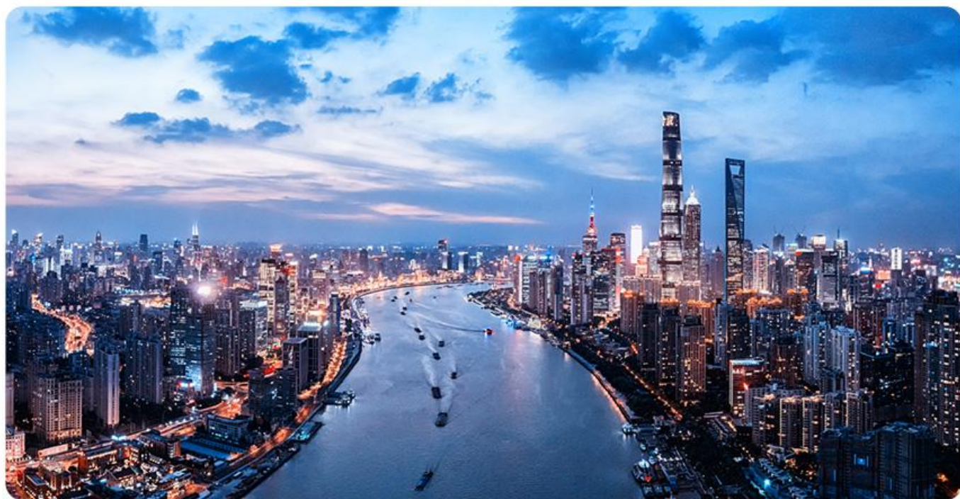
【上海登高环球金融中心（或金茂大厦）】