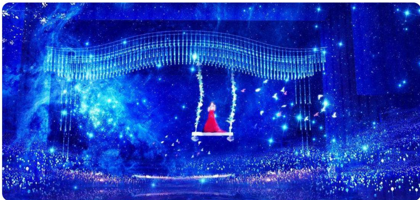
【邓丽君传奇全息音乐奇幻秀360°】