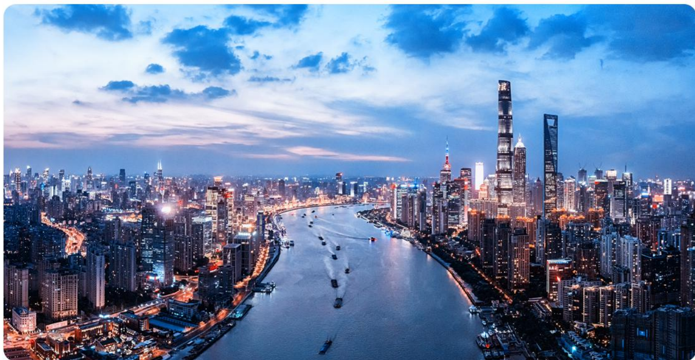
【登上海环球金融中心94层（或者金茂大厦）+黄浦江横渡船】