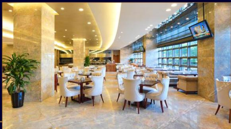
上海东江明城大酒店 GRAND VIEW HOTEL SHANGHAI