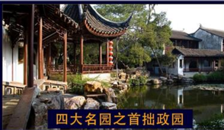
四大名园之首拙政园