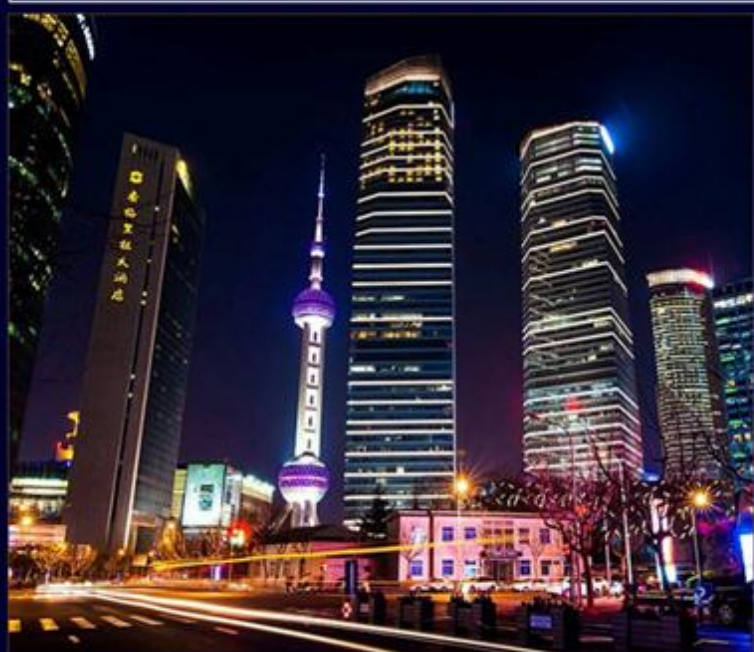
东方明珠, 南京路外滩 NANJING ROAD BUND