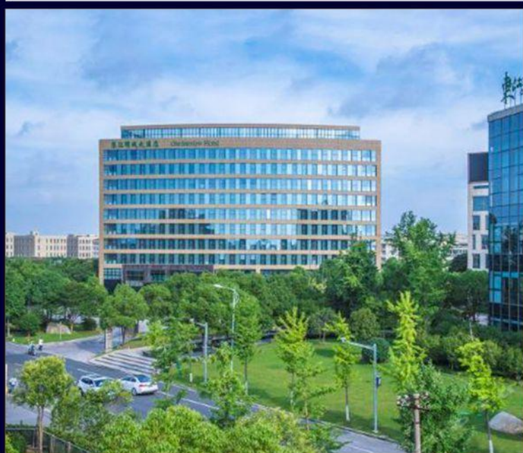
上海东江明城大酒店 GRAND VIEW HOTEL SHANGHAI