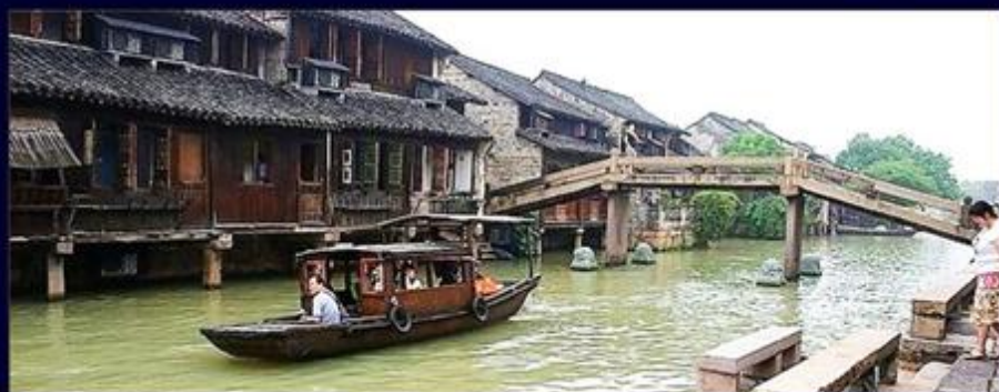
乌镇西栅 West gate, West Tong Old Town

Selected Attractions: only the best 5A attractions are arranged