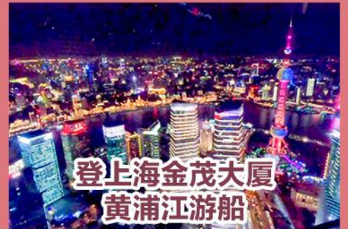
登上海金茂大厦 黄浦江游船