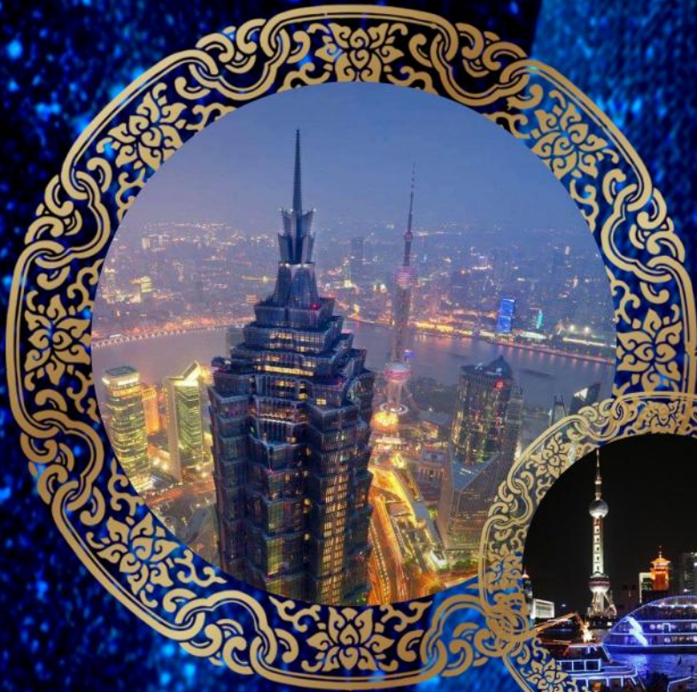
上海黄浦江游轮+登金茂大厦