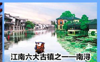
江南六大古镇之一—南浔