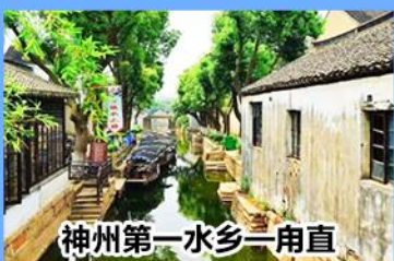
神州第一水乡—甪直