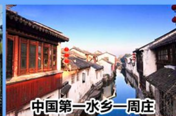
中国第一水乡—周庄