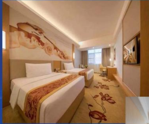
3晚五星欧式风格 维也纳国际酒店