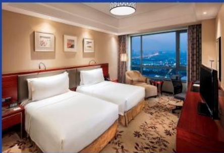
1晚国际五星 希尔顿酒店