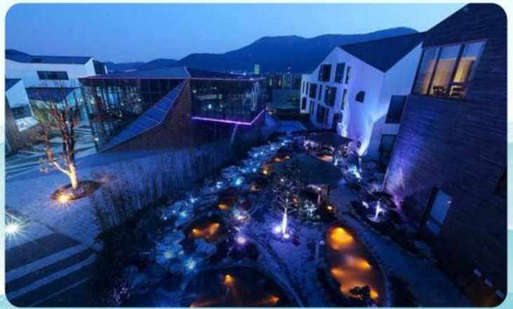
苏州温泉度假酒店