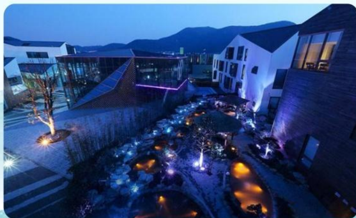
苏州温泉度假酒店