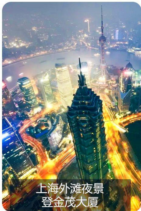
上海外滩夜景 登金茂大厦