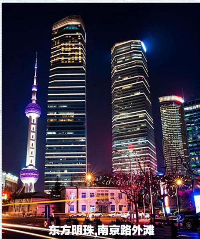
东方明珠,南京路外滩