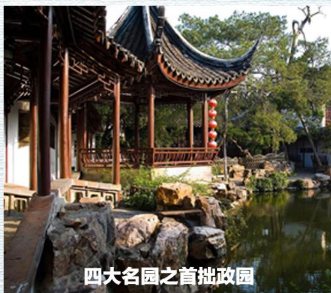
四大名园之首拙政园