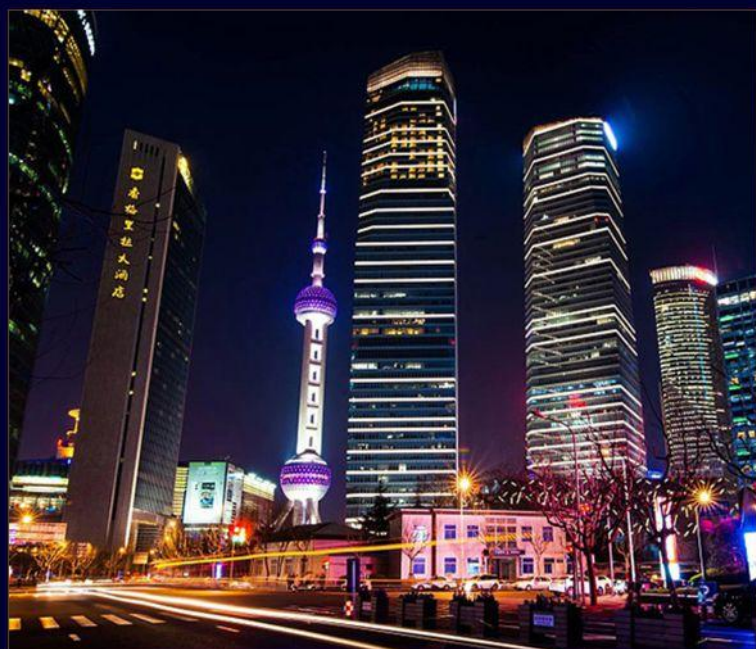
东方明珠, 南京路外滩 NANJING ROAD BUND