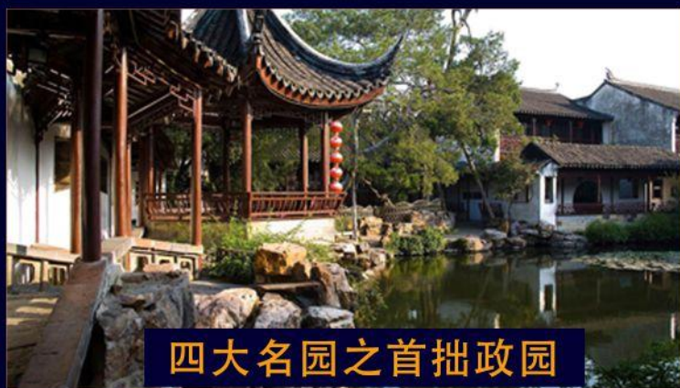
四大名园之首拙政园