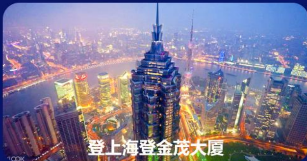
登上海登金茂大厦