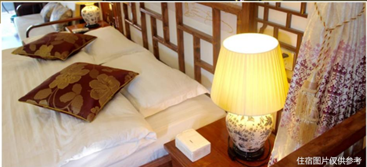
住宿图片仅供参考

时近傍晚，略收拾一下，出门经过数座小石桥，拐过数条小巷，逐渐闻得人声。此时大多游客已散，居民三两聊天，尽是家常，听不懂也饶有兴味。风雨廊柱漆身斑驳，身边有老者哼着小曲儿缓缓归家。入夜后避开拥挤地带，在河边任选一家小食铺都有美味：一条清蒸白鱼就一碗雪菜肉丝面，饱足且回味。再握上一杯冰镇酒酿，顺着河岸边一溜的红灯笼，越往住处走越飘忽，迎着幽幽的清风。