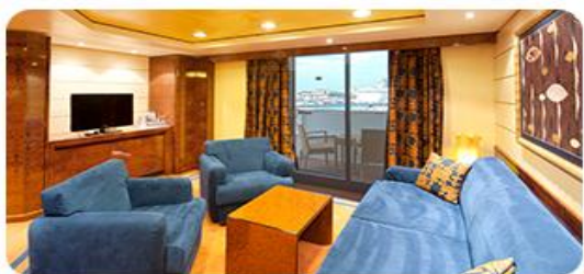
套房 家庭优选，通常带有阳台，空间更大，可优先办理登船手续，SP、SP2类型套房客人还可享有主餐厅独立就餐区域