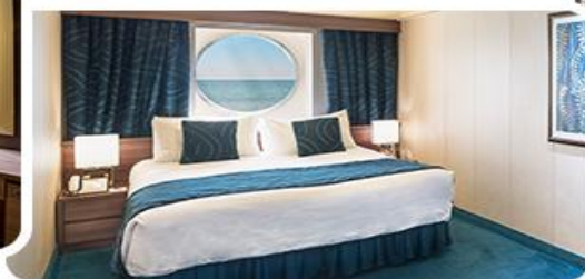
海景房 高性价比，布局精美，宜欣赏海景