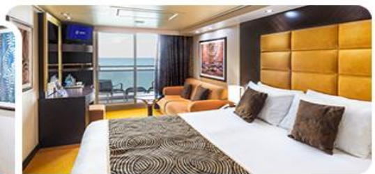
阳台房 舒适房型，房间宽敞，带有延伸阳台，推开房门就是海