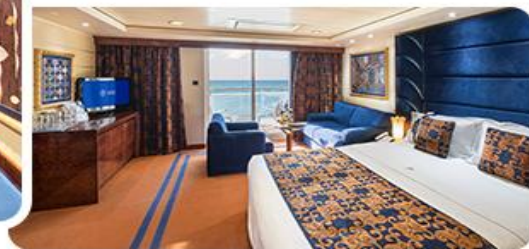
游艇会套房 优享房型，拥有专属用餐及活动区域，全程有专属管家陪同服务，可享受优先上下船、码头接送及专属贵宾休息室等多项礼遇