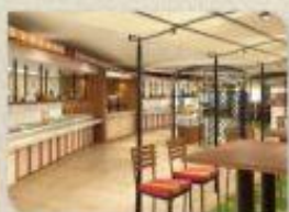
丽都市集 自助餐厅