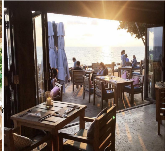
mango Bay On the Rock

地址： Ong Lang 沙滩， 富国岛， 坚江省 http://mangobayphuquoc.com/dining-cuisine/on-the-rocks-restaurant.html