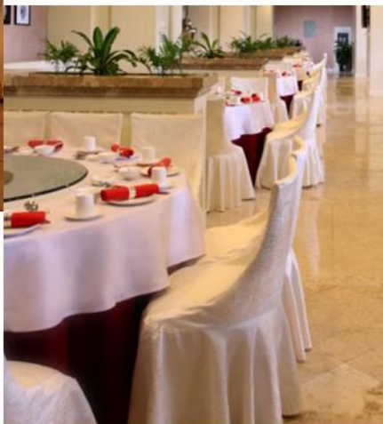
HOTEL RESTAURANT 酒店餐厅