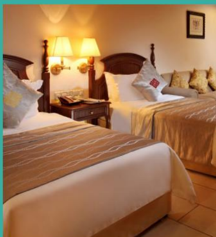
HOTEL ROOMS 酒店客房