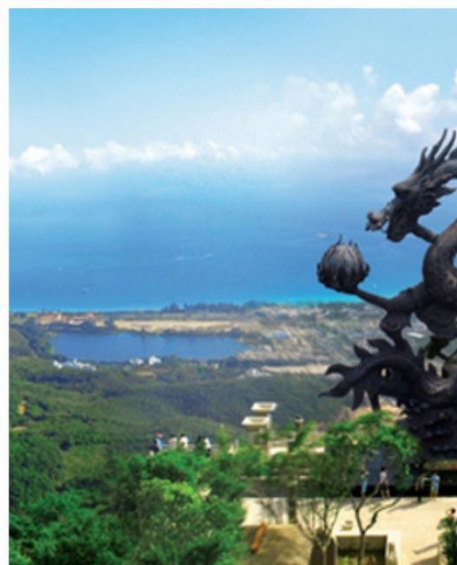
亚龙湾热带天堂 森林公园4A

#《非诚勿扰》、《亲爱的热爱的》取景地# #遥望亚龙湾# #雨林森呼吸# #网红打卡#