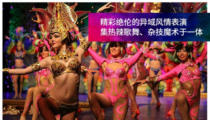
精彩绝伦的异域风情表演 集热辣歌舞、杂技魔术于一体