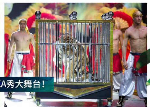
高品质综合演艺盛宴，仿佛亲临美国拉斯维加斯KA秀大舞台！