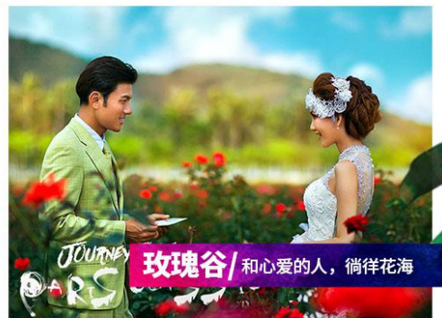
玫瑰谷/ 和心爱的人，徜徉花海