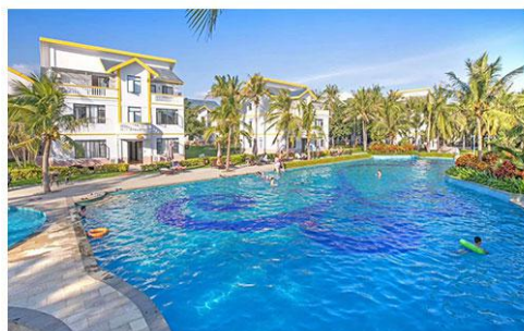
酒店800m 2 泳池