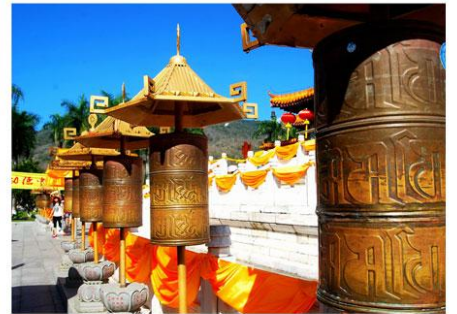
南山寺/ 祈福圣地，吉尼斯之最：108米海上观音