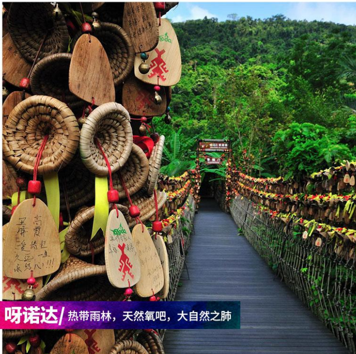
呀诺达/ 热带雨林，天然氧吧，大自然之肺