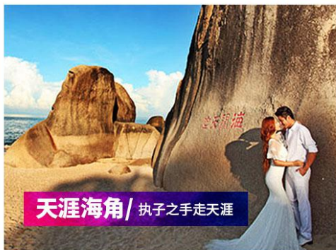
天涯海角/ 执子之手走天涯