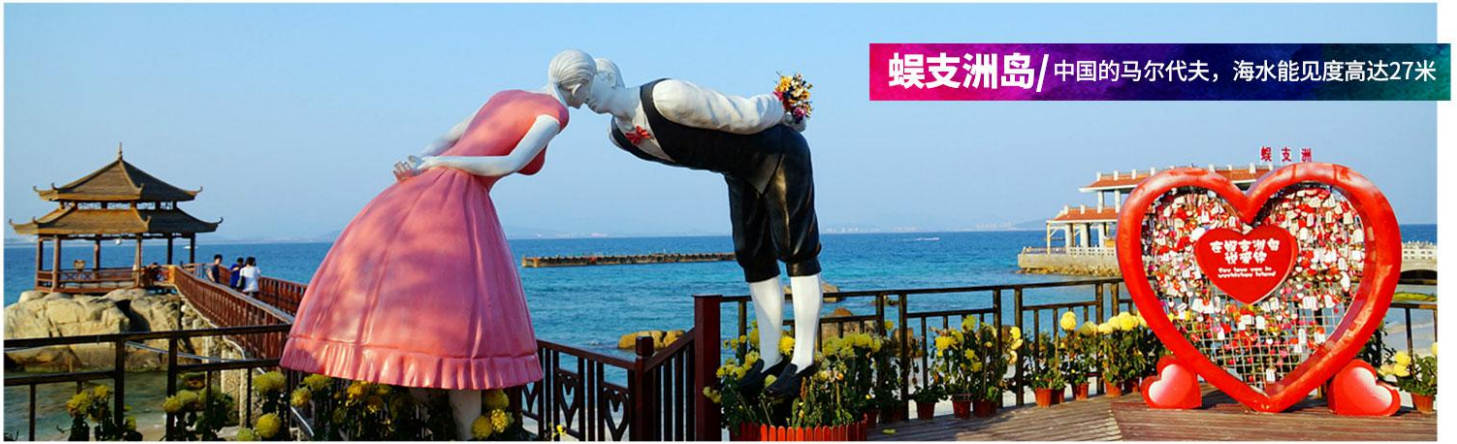
蜈支洲岛/ 中国的马尔代夫，海水能见度高达27米