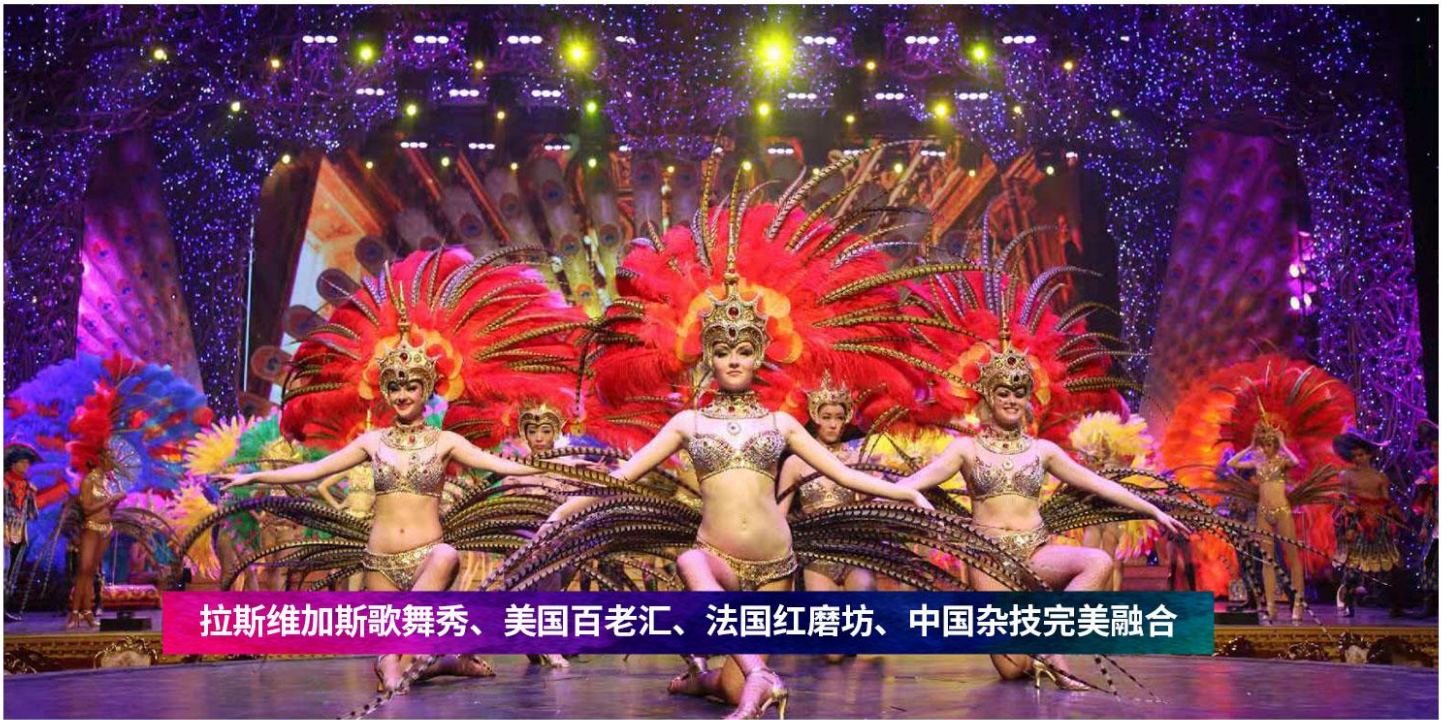
拉斯维加斯歌舞秀、美国百老汇、法国红磨坊、中国杂技完美融合