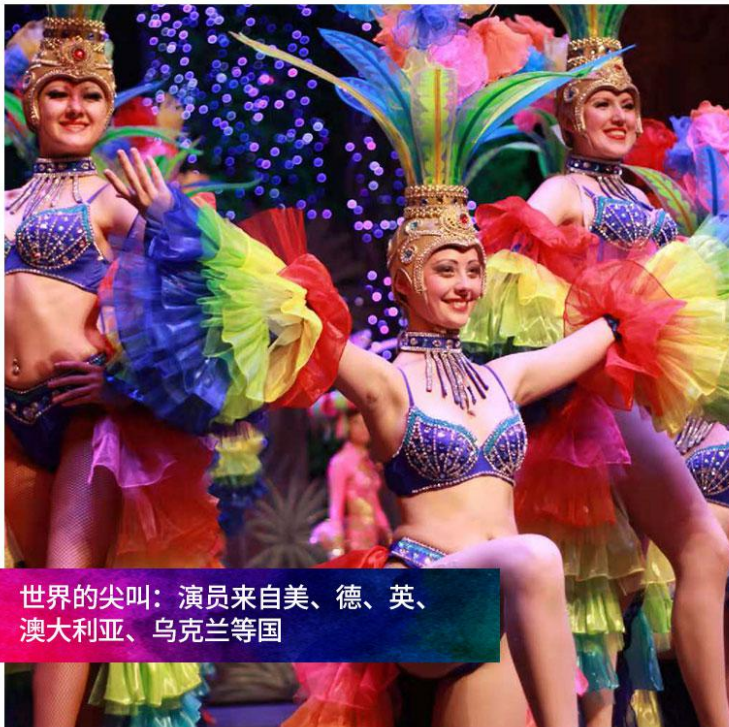
世界的尖叫：演员来自美、德、英、澳大利亚、乌克兰等国