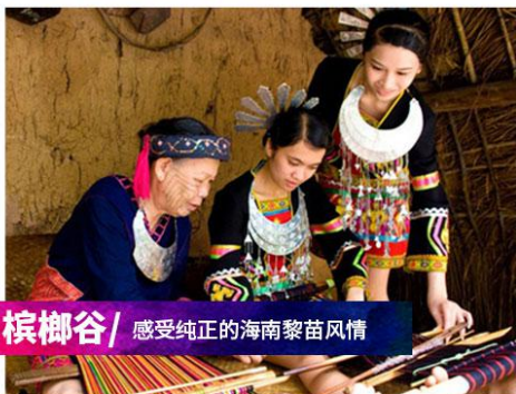
槟榔谷/ 感受纯正的海南黎苗风情