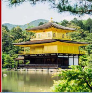
金阁寺 ろくおんじ 日本室町时代最具代表性的名园 1994年被列入世界文化遗产名录