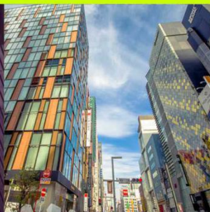
银座 世界三大繁华中心 东京标志 购物天堂