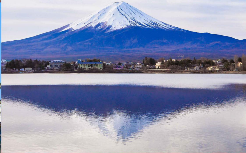
日本的最高峰 其山体延伸到骏河湾的海岸