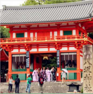
八坂神社 日本传统建筑 祭祀文化源流