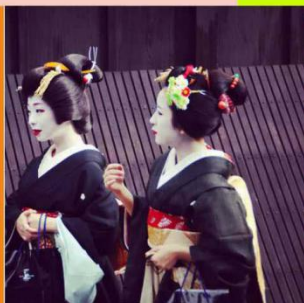
祇园 京都风情的街道 《艺伎回忆录》取景地