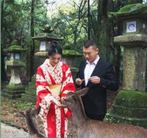
奈良 梅花鹿公园 零距离最好玩 喂食神使之鹿