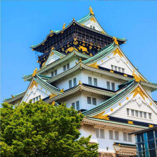
大阪城 スカイツリー 深受当地居民和国外游客喜爱 日本经典精华景点之一