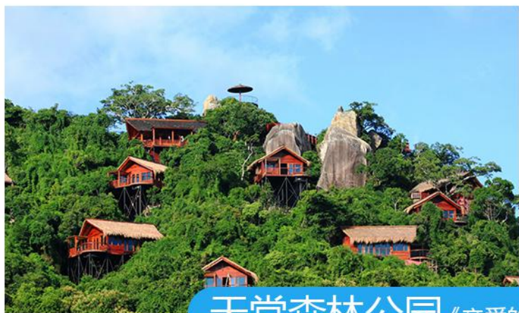
天堂森林公园 《亲爱的，热爱的》《非诚勿扰》拍摄地