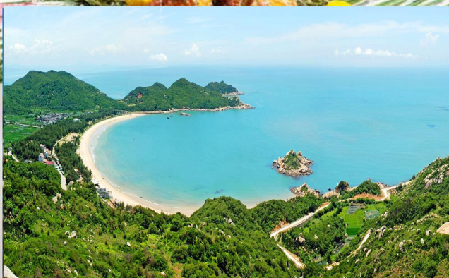
东方夏威夷【青澳湾】