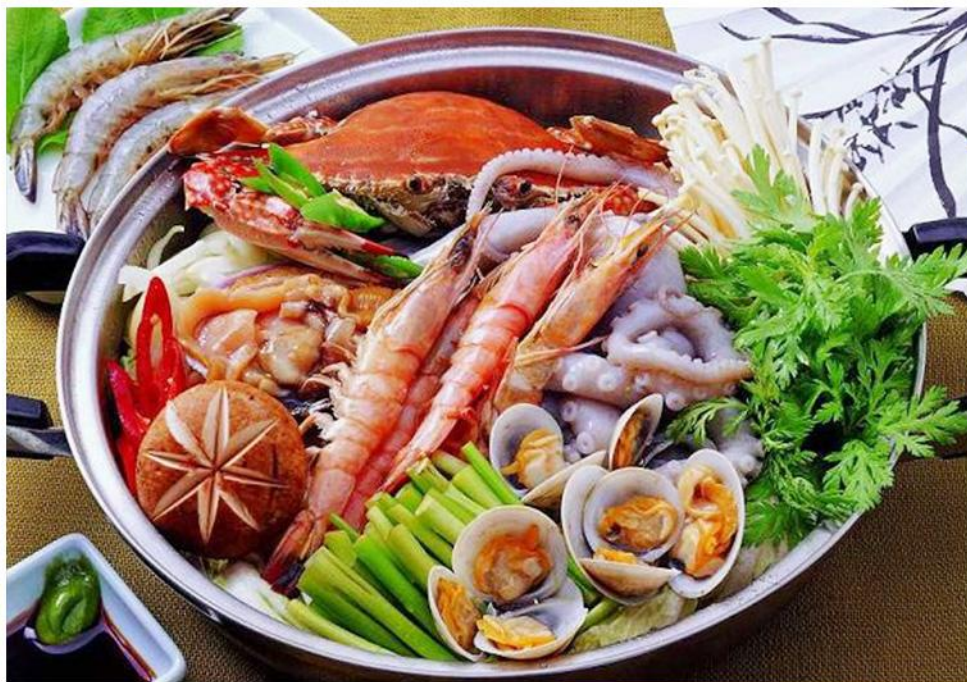
海鲜风味大餐/南山素斋/文昌鸡宴/社会小炒