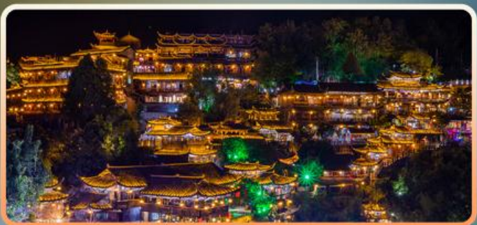
芙蓉镇 挂在瀑布上的小镇