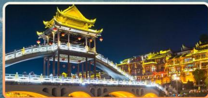
凤凰古城 等待千年的古城