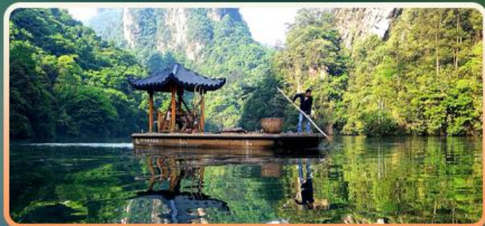
AAAA级景点宝峰湖 人间瑶池之称