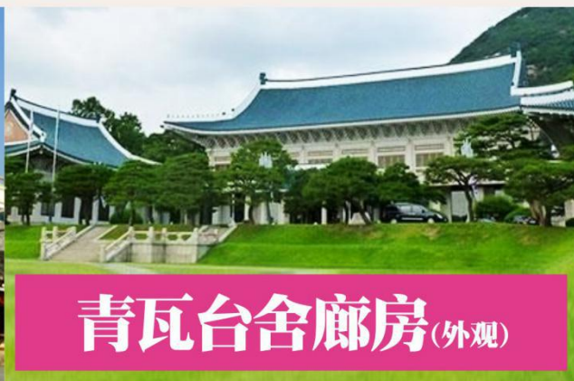
青瓦台舍廊房(外观)

位于景福宫内的国立民俗博物馆是展示韩国的传统生活方式的地方，是韩国唯一全面展示民俗生活历史的博物馆。