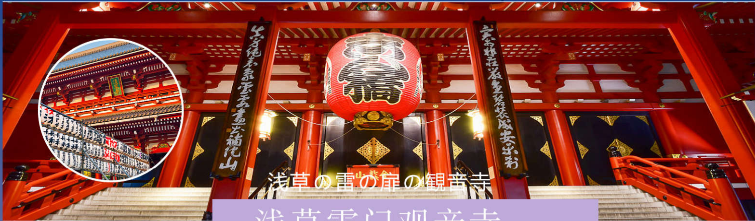
浅草の雷の岸の観音寺