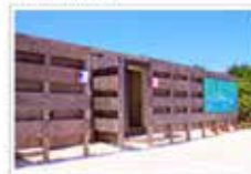
◆ 更衣室, 淋浴室