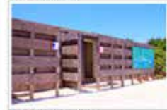
◆ 更衣室, 淋浴室