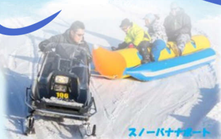
スノーバナナボート