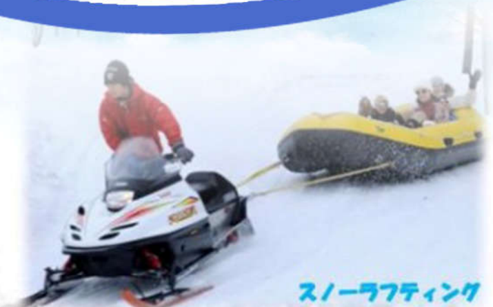
スノーラフティング